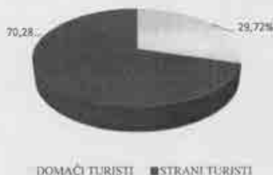
Udio noćenja domaćih i stranih turista u 2024. godini