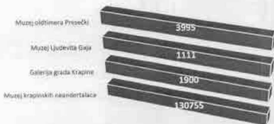
Tabela 5.: Usporedba posjeta muzejima u 2024. i 2023. godini